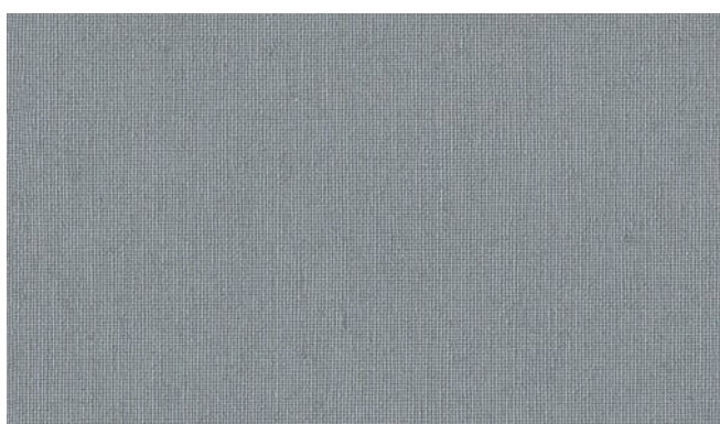
5770 French Grey