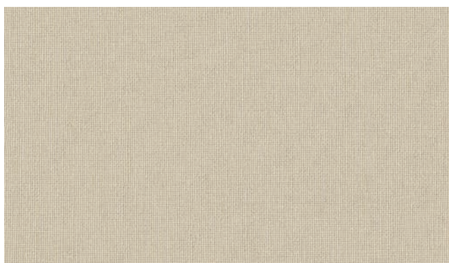
4899 Perfect Greige